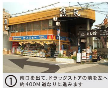
① 南口を出て、ドラッグストアの前を左へ約400M道なりに進みます