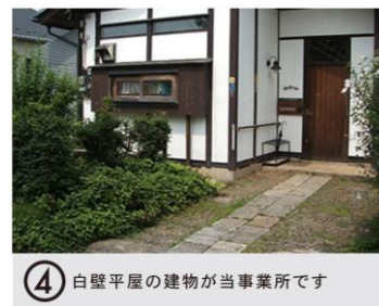
④ 白壁平屋の建物が当事業所です