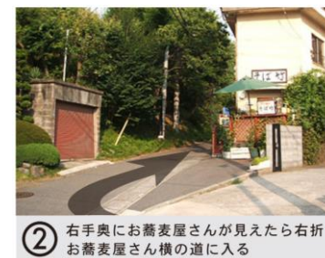
② 右手奥にお蕎麦屋さんが見えたら右折お蕎麦屋さん横の道に入る