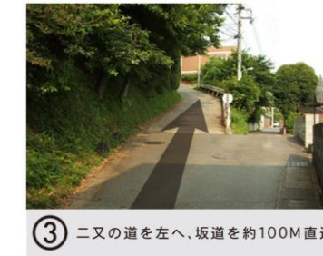
③ 二又の道を左へ、坂道を約100M直進